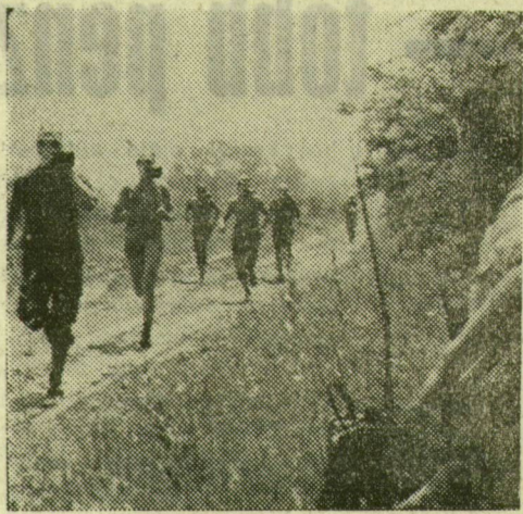
Asotthalmi ifjúgárdisták az akadályversenyen