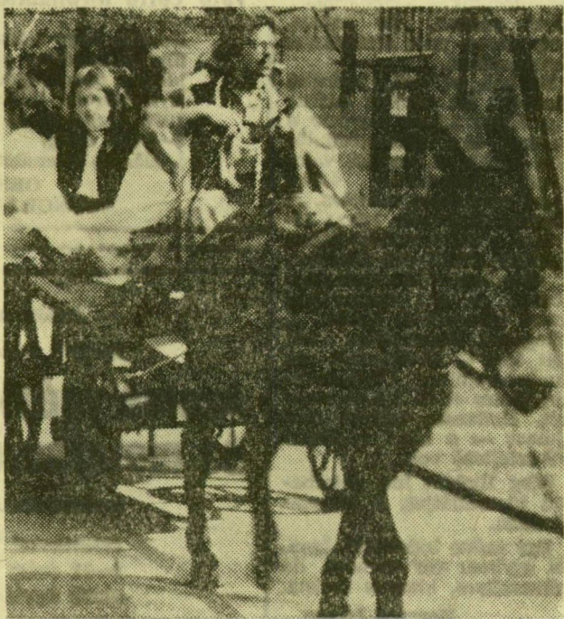
Egy kis városnéző és hírverő körséta — szamárkördén

Keszthelyen pénteken megkezdődtek a helikoni ünnepségek. A magyar diákélet kiemelkedő eseményére a Dunántúli középokú tanintézményeiből mintegy kétezer fiatal utazott Keszthelyre.