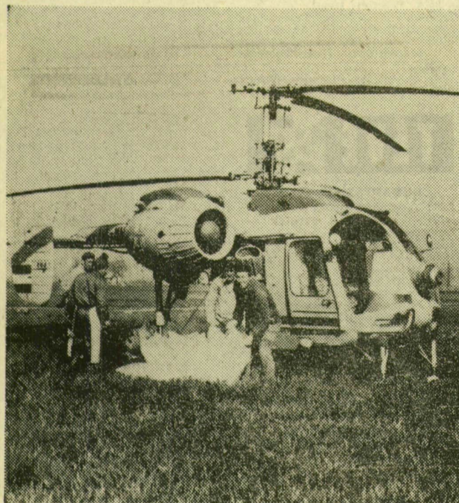
Felszállásonként 6 mázsa műtrágyát raknak a gép „gyomrába”