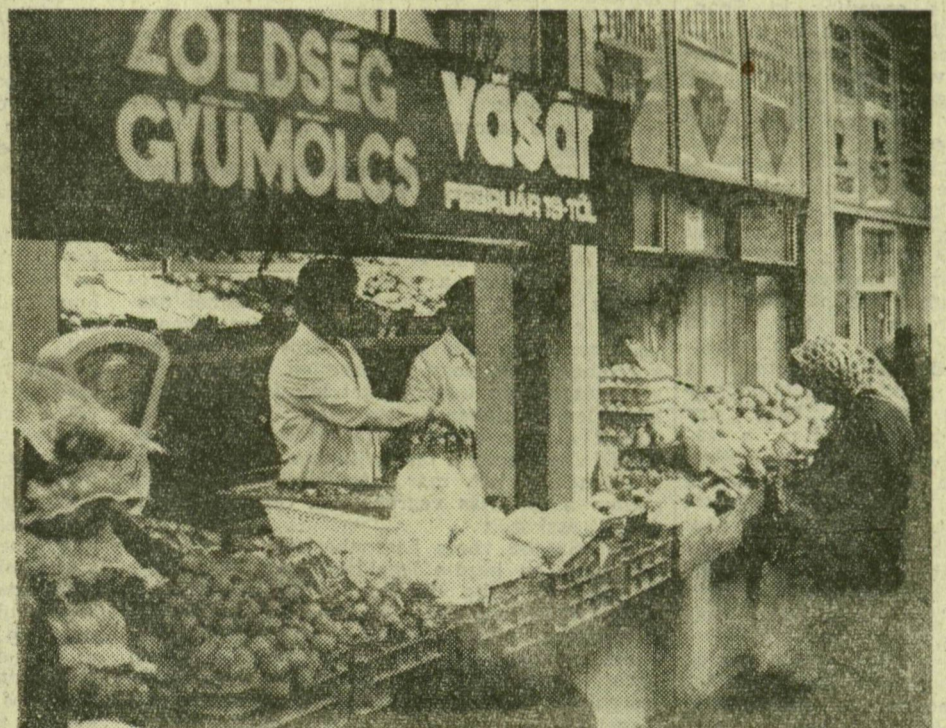
A csarnokbeli MÉK-kirakat rendezettségével is, gazdag választékával is vonzza a vásárlókat

tal — talán az átszervezésnek is köszönhetően — 40 százalékkal múlta felül a tavaly februárját, a zöldségtélek kínálata például — kivéve a fokhagymát és vöröshagymát — duplájára emelkedett. Tavaly nem volt körte a téli piacon, az idén lehet kapni; 1976-ban 37 mázsa fejés káposztát adtak el, most 147 mázsát. Mindez azonban inkább csak a kis- és közepes árú termékek javára írható. A kedvező feltételeket, kedvezményeket ugyanis tavaly körlevélben ismertették a környék s a szomszédos megyék termelőszövetkezeteivel, fogyasztási szövetkezetivel, tanácsai szerveivel. Válasz azonban sehonnán sem érkezett. Ugy látszik, a térszerek vonakodnak a piaci árusítási formáktól, s ezt a fedett csarnok tavalyi adatai is igazolják. A 60 milliós forgalomban 37,7 százaléka húsból, 35,8 százaléka vegyes élelmiszer és csak 8 százaléka volt gyümölcs és zöldség. A Szegeden eladott piaci áruknak tavaly csak 5,8 százalékat kínálták termelőszövetkezetek. S ez aránytalanul kevés.