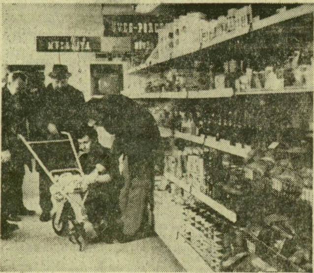
Újszegedi kertés övezetében, a Marostó utca sarkán iparcikkboltot nyitott tegnap délután a szegedi fogyasztási szövetkezet. Az új üzlet bő választékban kínálja a mezőgazdasági-kertészeti eszközöket, a háztáji és kisgazdaságok árutermelését szolgáló felszereléseket, és természetesen megvásárolhatók a háztartás mindennapi cikkei is

A csecsemő- és gyermekruházati cikkek választéka bővült ugyan, de itt is vannak hiányok. Időnként továbbra is nehezen lehet kapni gyermekmérleget, papírpelenkát, szintetikus tipegőt, gyakran hiánycikk a gyermekágy, a járóka, az etetőszék, sok még a panasz a gyermekcipők minőségére és egyes méretek hiányára is.