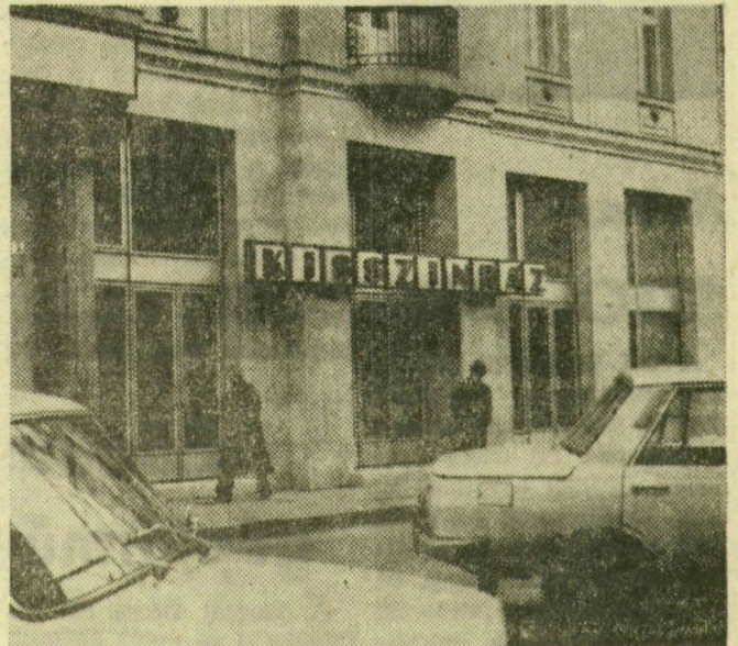
A Kisszínház bejárata