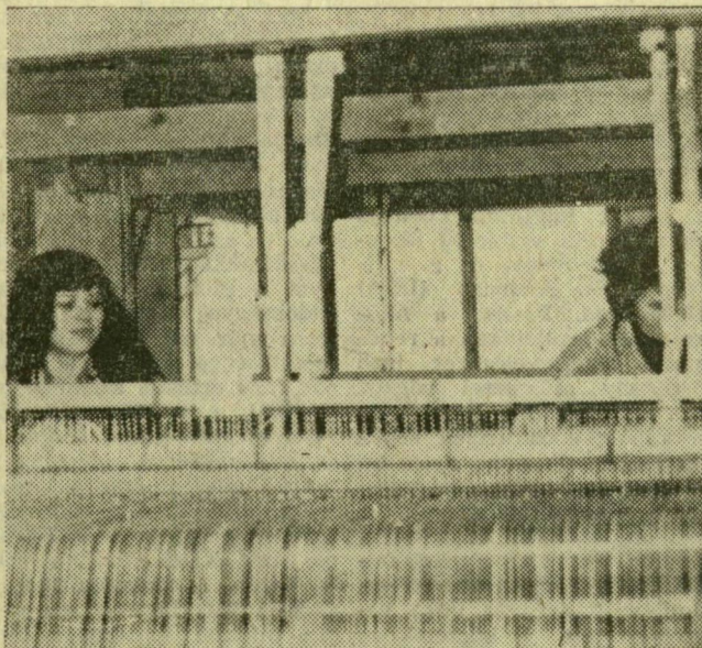
A szőnyegszővést még nem sikerült gépesíteni