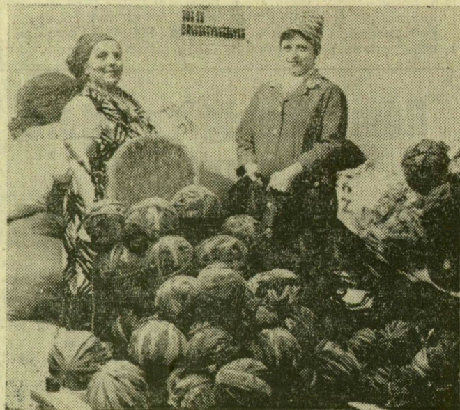
A divatszőnyeg alapanyaga a rongygombolyag

Végváznak széleiből, mindenfajta textilanyag hulladékából készíti a Szegedi Háziipari Szövetkezet algyői telepe rongyszőnyegeket. A saját erőből épített, 480 négyzetméteres műhelycsarnokban tavaly 76 ezer négyzetméter szőttek, s szállítottak külföldi megrendelőknek. A határokon túl egyre divatosabb rongyszőnyegeket mellett 1 millió forint értékű vesszőkosarat is fontak, amely ugyancsak külföldi piacra kerül. A több millió értéket 35 alkalmazott és 60 bedolgozó termelte. Az 1977. évről már megkötötték az első szerződéseket: NSZK-ba és Svédországba 88 ezer négyzetméter rongyszőnyeg keli szállítani.