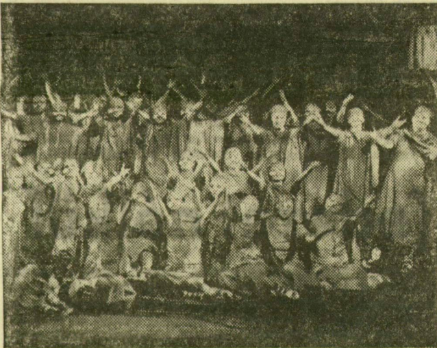
A tömegsír képi látványa

„A sötét árnyak közül, melyek az ember nevét elhomályosítják, a legsötétebb az embertelenség. A legiesztöbb embertelenség pedig az erőszak, melyet azokon követnek el, akiket az emberek között mesterségesen és erőszakkal teremtett különbségek ártatlanul megfosztottak emberi jogaiktól. Goran ezek ellen emelt szót. És azok ölték meg, akik ennek az embertelenségnek a nyomán haladtak.” Így nyilatkozott a komponista, Nikola Hercigonja a mártírhaltalt kortársáról: Ivan Goran Kovačevićről. Aki a népfel-szabadító harcokban maga is részt vett, partizánok között írta meg az embertelenség áldozatainak himnuszát, a Jamát, s aki tragikus módon maga is osztozott hőseinek sorsában: a jugoszláviai harcok során 1943-ban meggyilkolták a csetnikek.