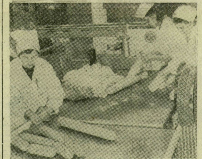
Az egyik végtermék, a szalámi töltése