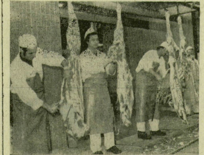
Sertésfeldolgozás — konvejpályán

Még nincs egy hónapja, hogy átadták a bővített, korszerűsített szalámigyárat Szegeden, a vágóhíd helyén. A ke-reken 1 milliárd forintért épült új feldolgozó üzem, vágóhíd és szalámigyár kapacitása megkétszereződött. Évente 10 ezer tonna szalámit termelhetnek és 5 ezer tonna húst dolgozhatnak fel, ami jelentősen javítja a hazai ellátást és az exportot is. Az üzemrészekben készült képriportunk.