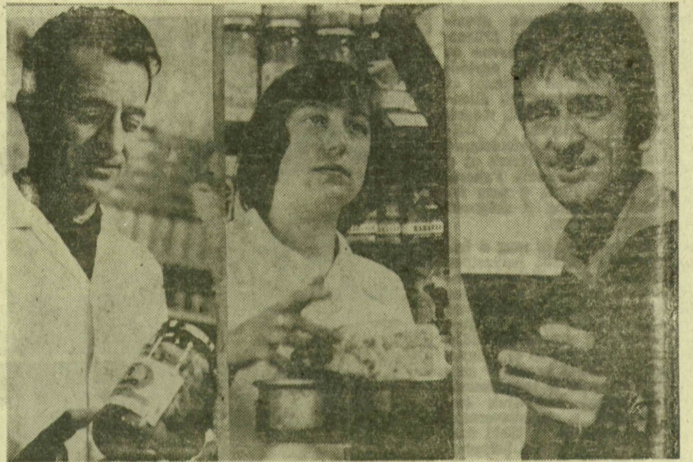
Képünkön: az apa, a leány, a fiú

Egyazon családban az apa foglalkozását, hivatását vagy elhivatottságát rendszerint nem szokta választani több gyerek. Legfeljebb egy, a legkisebb vagy a legnagyobb, és pedig a legapásabb, aki példaképét látja a család kenyérkeresőjében. Tehetséget, különös adottságot, valamihez nagy hajlandóságot is lehet örökölni és azt kamatoztatni, a tökélyig fejleszteni, csiszolni, többre menni vele, mint az, akitől örököltük. Az ilyen öröklődésből alakulhat ki olyan dinasztia, mint a kereskedő Kátyi Lázáré is. Rendhagyó eset: az apa foglalkozását választották és folytatják a gyerekek, a fiú is, a lány is.