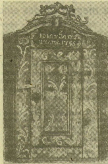
Hódmezővásárhelyi saroktéma, 1795-ből