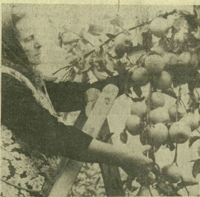
Az ásóthalmi Felszabadulás Tsz-ben bő almatermést takarítanak be

tás idejét úgy kívánják le- rövidíteni és ütemét gyorsá- títani, hogy egymást segítik majd gépekkel a nagyüzem- mellett gumikerekes gabona- kombájnokokat is munkába állít- tának.