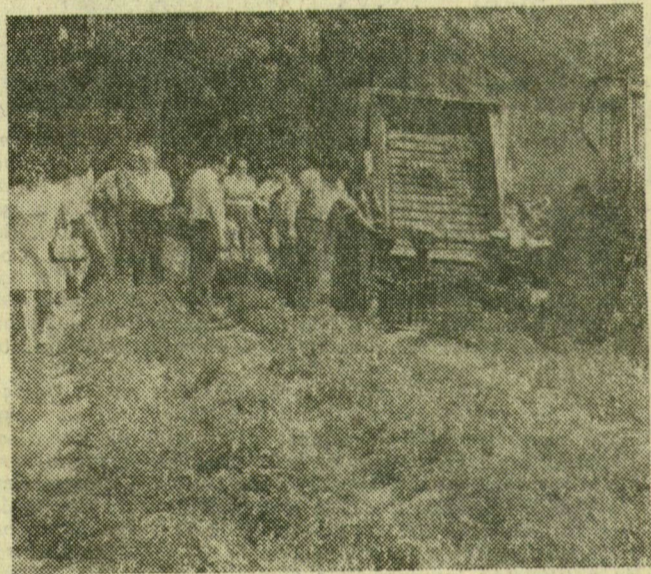
A paradicsomszedő kombajn munka közben