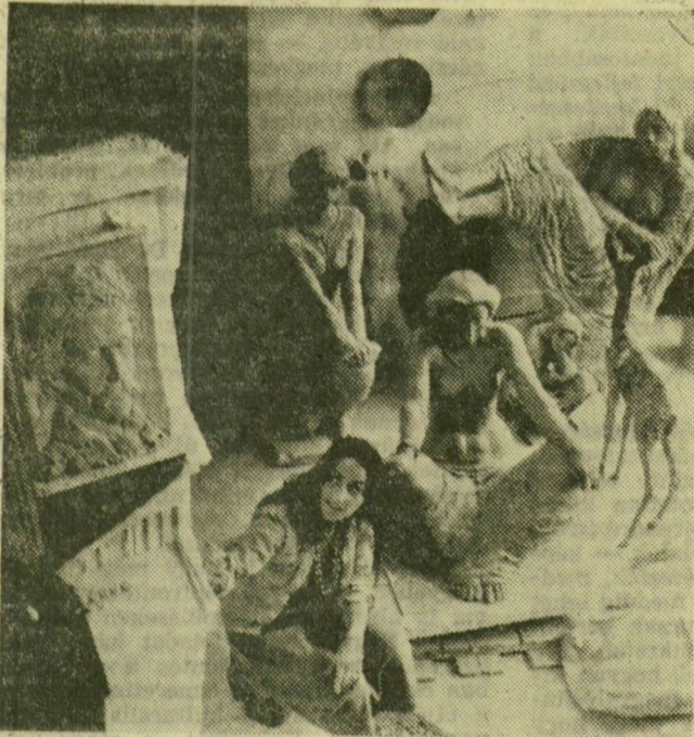
Szobrok között a műteremben