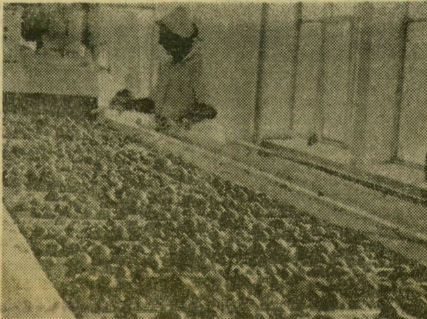
Szalagról válogatják a paradicsomot a sűrítmenyhez