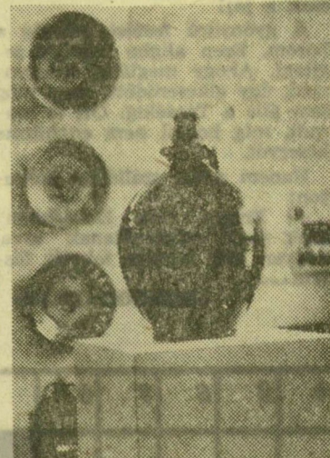
Részlet a Mónus-testvérek tárlatáról

dor Emil, Kovács Margit — alkotásait tömegek szeretik, tisztelik és értik. A modern magyar kerámia e vezérégyéniségének sajátos nemzeti művészete nagyszerűen ötvözi a magyar népművészet elemeit, a pravoszláv ikonok naívan áhítatos báját, a középkori miniatúrák esett időt-