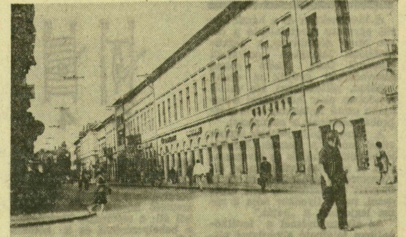
A történeliség fogalmát lassan ki kell terjeszteni a XIX. századi együttesekre is

A Városépítésnek — az Építőipari Tudományos Egyesület és a Magyar Urbanisztikai Társaság folyóiratának — alig akad olyan száma, mely valamilyen megközelítésben ne foglalkozna Szegeddal. A most megjelent 1976/1-2. számban pedig éppenséggel cikkek sora szól róla. Erdemes tallózni benne, hadd lássuk, miként vélekednek a szakemberek Szegedről.