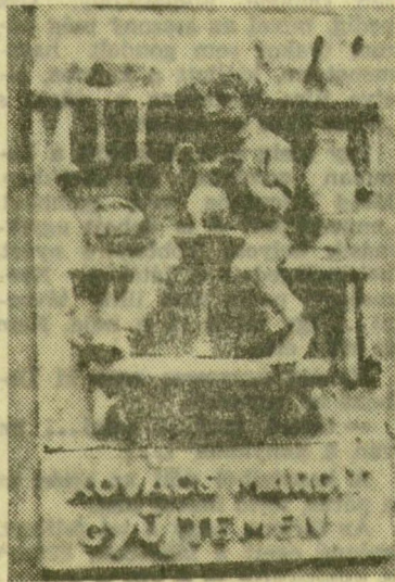
A Kovács Margit-gyűjtemény kerámiai-cégre az egykori Vastagh-ház falán