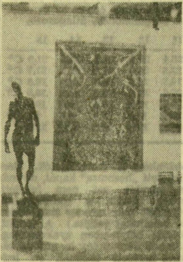
Ferenczy Béni és Noémi alkotásai

Ferenczy-múzeummal szemben, az egykori Vastagh-házban 1973-ban nyílt meg a Kovács Margit-gyűjtemény. A vörös vakolatú falak, a barokkos vascsipkeablakok mögött, a főfőherre meszelt szobákban, fülkékben, állványokon, padkákon ragyogó kerámiák: faliképek, reliefek, figurális alkotások, tányérok, edények, vázák. Az egyik sarokban a híres lakodalmas kályha. A magyar kerámiát megújító nagy triász — Gorka Géza, Gá-