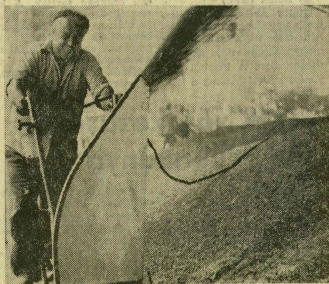
Biztonságban a termés, fedél alatt a gabona

Gazdaságaink dolgozói ha- mar fölismerték, hogy az aszály szántóföldi kultúrák- ban okozott veszteségeit enyhíteni kell és enyhíteni lehet. Legtöbb helyen takar- mányt és burgonyát vetettek, illetve zöldségféléket palán- táltak a kenyérgabona he- lyére. Számos gazdaságban megkezdtek már az őszi ve- tések előkészítését is.