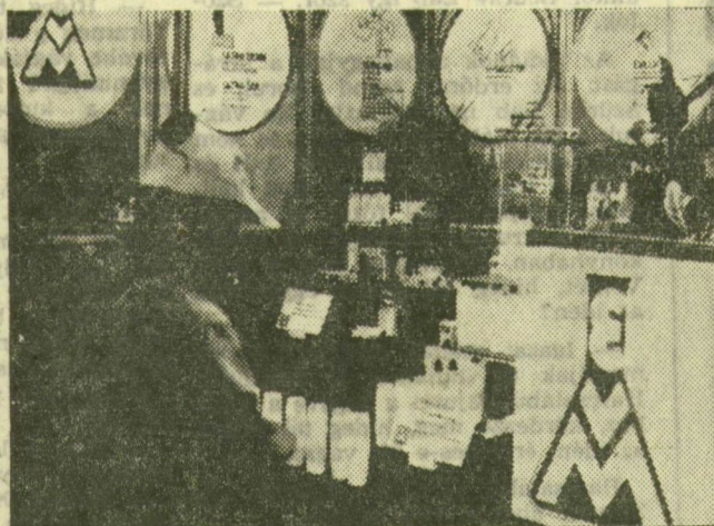
Az Egyesült Vegyiművek bemutatója

Sok hasznos cikket mutat be a Meteor Szövetkezet, vasalódeszkákat, állványokat, előszobafalakat, fogasokat,