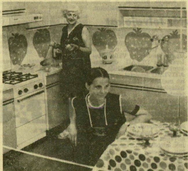
A Tisza Bútoripari Vállalat izléses konyhabútorai