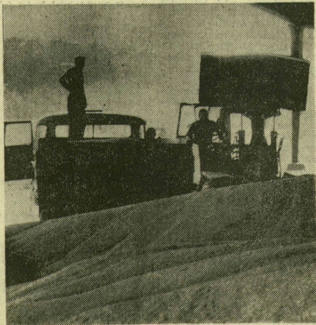
Tiszaszigeten a szárított gabonát szállítják a raktárba

A nyári eső mindig a legjobbkor jön, de ha a mostani, zivataros időjárás egy héttel később köszön ránk, bizony már komoly gondokat okozhatott volna a mezőgazdaságnak a szárazság. Hétfőn éjszaka megint a gazdálkodók kedvében járt az idő, bőséges csapadékkal áztatta a földeket. Sajnos, Kiszombor, Derekegyház és Szentés környékén a jégeső jelentős károkat okozott. Errefelé annyi csapadék esett, amióta a növények újból életre kaptak. Felüdült a határ, és a tészgazdák bizakodva végzik további teendőiket.