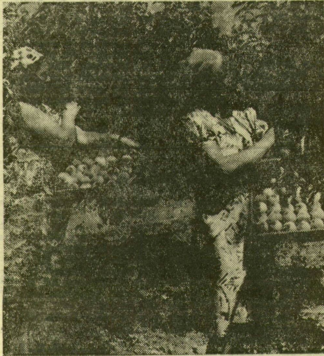
A szatymazi Finn-Magyar Barátság Termelőszövetkezetben szedik az őszibarackot

A növények fejlődésének kritikus időszakában köszöntött be a forró nyár. A közel két hete tartó csapadékszegény idő miatt szomjas a föld, népiesen szólva „furylyázik” a kukorica, és félt, hogy a gabona is kényszeréretté válik. A zöldségfélék közül a paprika sínyli meg legjobban a vízhiányt, ezért a járás paprikatermelő gazdaságaiban, nyújtott műszakban öntöznek. A baksi Magyar-Bolgár Barátság Termelőszövetkezetben több MA 200-as és MA 300-as öntözőgép öntözi a piritamin és a fűszerpaprikát. A domaszéki Szőlőfűrt Szakszövetkezet is a közös fűszerpaprikaterületet öntözi. Itt külön érdekesség még az, hogy a magról vetett fűszerpaprika bízaton fejlődik. A szegedi Móra Ferenc Termelőszövetkezet a Fehértől műgötti területen ültetett fűszerpaprikát öntözi. A tűz naposítás sajnos hamar felszáradítja a beöntözött területet, és nagy a párolgási veszteség. Ezért kora reggeltől késő estig működnek nyújtott műszakban a szivattyú-motorok.