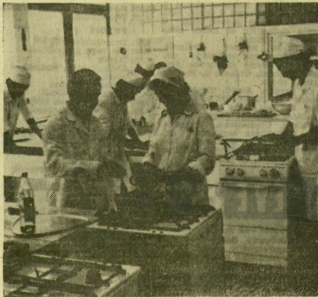
Munka a tankonyhában

Jelentős esemény színhe- lye lesz ma, szombaton dél- előtt 10 órakor a vásárhelyi Vendéglátóipari Szakközép- iskola, Kereskedelmi és Ven- déglátóipari Szakmunkás- képző Intézet és Kollégi- um: az intézmény Komócsin Zoltán, a magyar munkás- mozgalom kiemelkedő alakja, a korán elhunyt po- litikus, államférfi és nem- zetközileg ismert publicista nevét veszi fel.