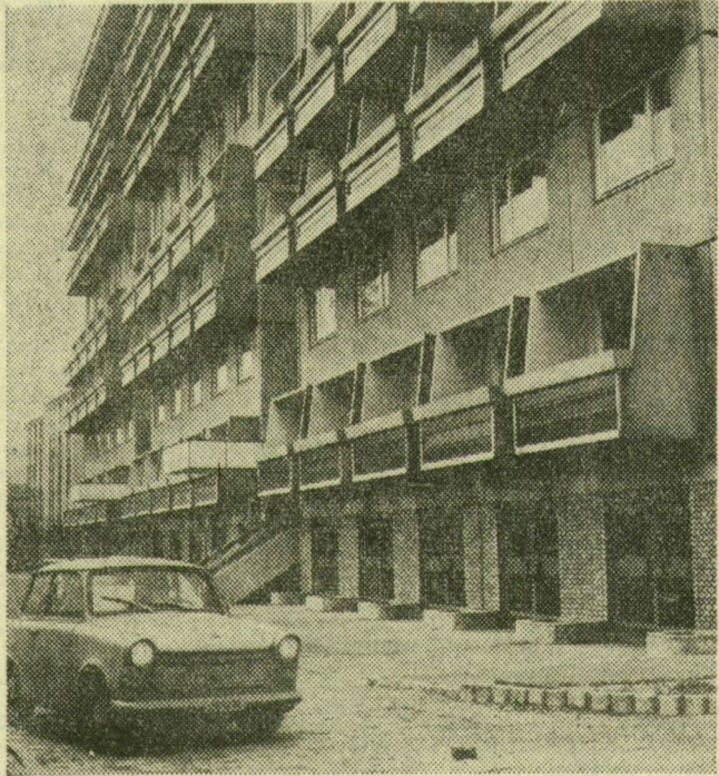
Újszegeden, a Sportcsarnok mellett felépült a fiatalok otthona, vagy ahogy egyszerűbben hívják: garzonház, és megkezdődött a beköltözés

A fiatalok otthonában 300 garzon, hivatalosan mondva lakóegység várja a beköltözőket. Amikor ezt a házat tervezték, azzal az elhatározással adta a tanács a pénzt, hogy ily módon a különölköt, fiatal házasságok, egyedül élőket kultúrált, és olcsóbb lakószobához juttatja, mint amilyen az albérlet. Elsősorban családalapító fiataloknak szánt segítségül van szó. Még pontosabban: a fiatal házaspárok lakásuk felépítéséig olyan elhelyezést kapnak, ahol biztosítani lehet az anyagi feltételek megteremtését. A garzonház néhány évre mindenkinek (maximum 5 év) átmeneti