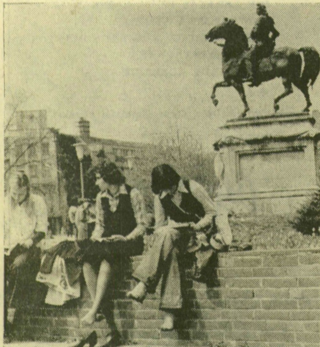
Somogyi Károlyné felvételei