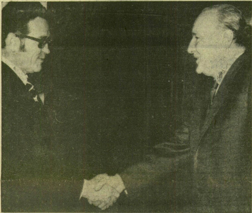
Kádár János fogadja Sztanko Todorovot

Befejeződtek a magyar—bolgár tárgyalások