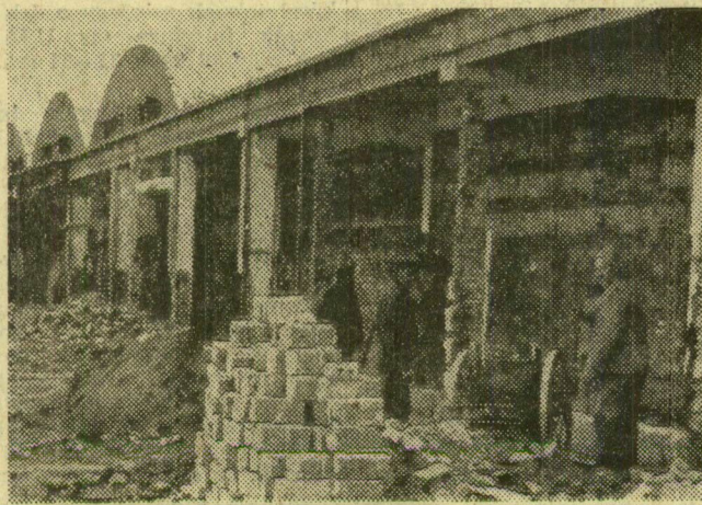
Az építőbrigád a hűtőtorló korszerűsítésén dolgozik

A konyhakész zöldségek csomagolása nem új a vállalatnál. Néhány éve terjedt el az üzletekben a fóliacsomagolt tisztított sárgarépa, zöldség, zeller, hagyma összeállítás. A kereslet megnövekedése tette szükségessé az üzem bővítését.