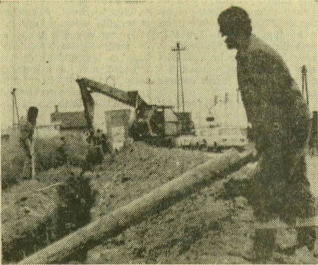
Néhány méternyi árkot kell még ásni a vezetéknek

A brigád tagjai tudják, hogy a két település számára milyen fontos ez a munka. A lehetőségekhez mérten nagyon igyekeznek, hiszen kérik a kivitelezés az eredeti határidőhöz képest. A múlt hónapban például gép nélkül dolgoztak, kézi erővel ásták az árkot. A vállalat gépeit