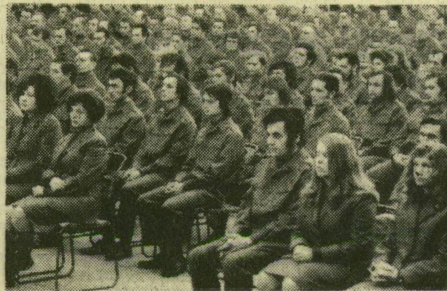
A gyűlésen részt vevő munkásörök egy csoportja