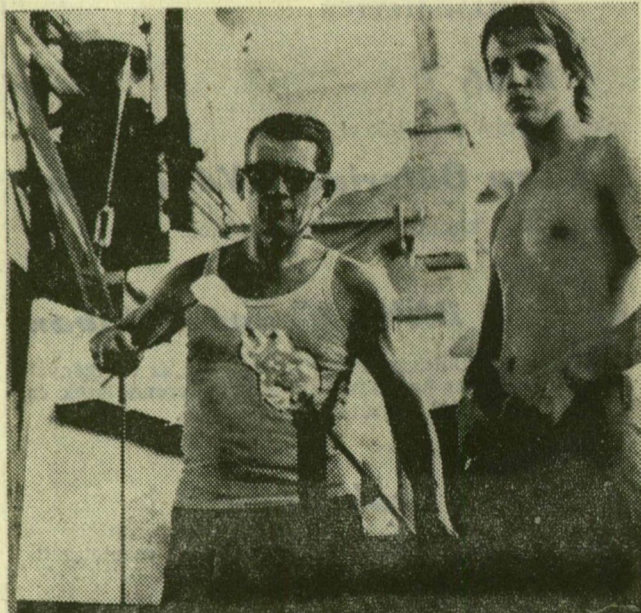
Az üvegtormálás mesterei a kemencék előtt

Hazánk legrégebbi üvegyára a parádi. A több ütemben végrehajtott rekonstrukció eredményeként az idén már 15 százalékkal növekszik a termelés. Olyan új berendezéseket szereltek fel, amelyekkel egy művelettel végezhető el a különböző üvegáruk csiszolása. A kétszázhatvan esztendő óta üzemelő üvegyár 70 millió forint értékű árut exportálnak, többek között Angliába, az Egyesült Államokba, Kanadába, Franciaországba, Svédországba. Az Üvegipari Művek parádi gyára egyébként idegenforgalmi nevezetesség is. A hazai és külföldi turistáknak bemutatják azt az üzemrészt, ahol a kemencék mellett az üvegfúvók dolgoznak. Az öreg gyár munkásainak zöme fiatal, a harmadéves ipari szakmunkástanulók önállóan dolgoznak. Képeink bepillantást nyújtanak a szebbnél szebb üvegek gyártóműhelyeibe.