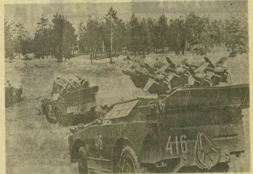
Páncélozott járművek, harcokcsi-elhárító rakétával felszerelve

Hazánk, a Magyar Népköztársaság — több mint két évtizede — olyan nemzetközi szervezet tagja lett, amely következetesen megvalósította ez idő alatt az „egy mindenkiért, mindenki egyért” elvet. A Varsói Szerződés Szervezetéről van szó, amely 1955. május 14-én kontinensünk szocialista államai kollektív önvédelmi szerveként lépett a nemzetközi politikai porondra.