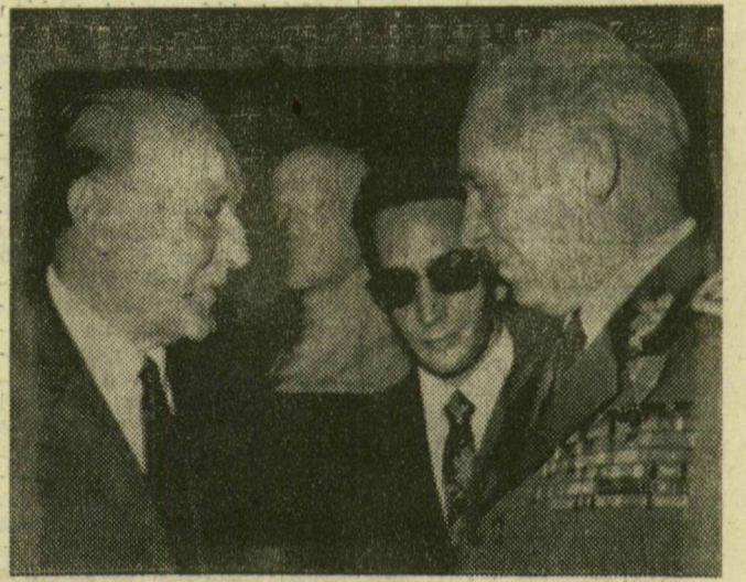
Kádár János a Központi Bizottság székházában fogadta a Martin Dzur vezette csehszlovák küldöttséget

A Népköztársaság Elnöki Tanácsa a magyar és a csehszlovák nép közötti barátság, a Magyar Néphadsereg és a Csehszlovák Néphadsereg közötti kapcsolatok erősítése terén szerzett érdemek elismeréséül kitüntetések adományozott a hivatalos, baráti látogatáson hazánkban tartózkodó cseh-