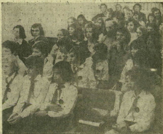
A gyűlés résztvevőinek egy csoportja

Megnyitót Illés Tóth István, a KISZ Szeged városi bizottságának titkára mondott. Réti István, a Volán pártbizottságának titkára méltatta a chilei Népi Egység kormányának ezernapos hatalmának eredményeit. Megemlékezett a két évvel ezelőtti szeptember 11-éről, arról a nappal, amikor az ország törvényesen választott vezetőjét, dr. Salvador Allendét meggyilkolták az ellenforradalmárok. Az erőszak, az önkény lett úrrá az országon. Börtönre változtak a stadionok, emberek ezrei tüntek el nyomtalanul. A mostani szeptember 11-én – hangoztatta – kifejezzük a