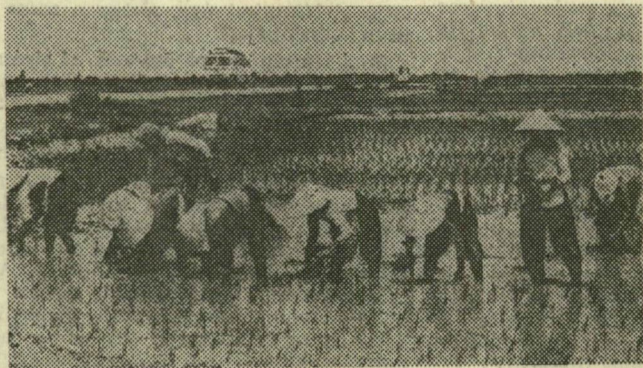
Az amerikaiak koncentrációs táboraiból a felszabadulás után hazatért Hoa Khanh-i parasztok dolgoznak egy rizsföldön Dél-Vietnamban. My Tho tartományban

A háború vérvizatarai után immár békés élet köszöntött Vietnam népére. Képeink, amelyeket a VNA, a Vietnami Távírási Iroda riporterei az idén nyáron készítettek, erről adnak mozaikot.