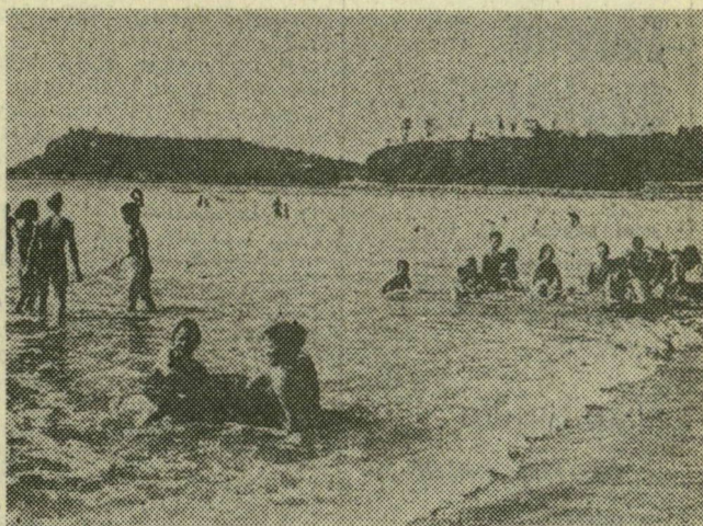
Több száz dolgozó tölti nyári szabadságát szakszervezeti beutalóval a Haiphongtól délre elterülő Do Son-i tengerparton, vagy a hegyekben. A képen: Beutáltak a tengerparton