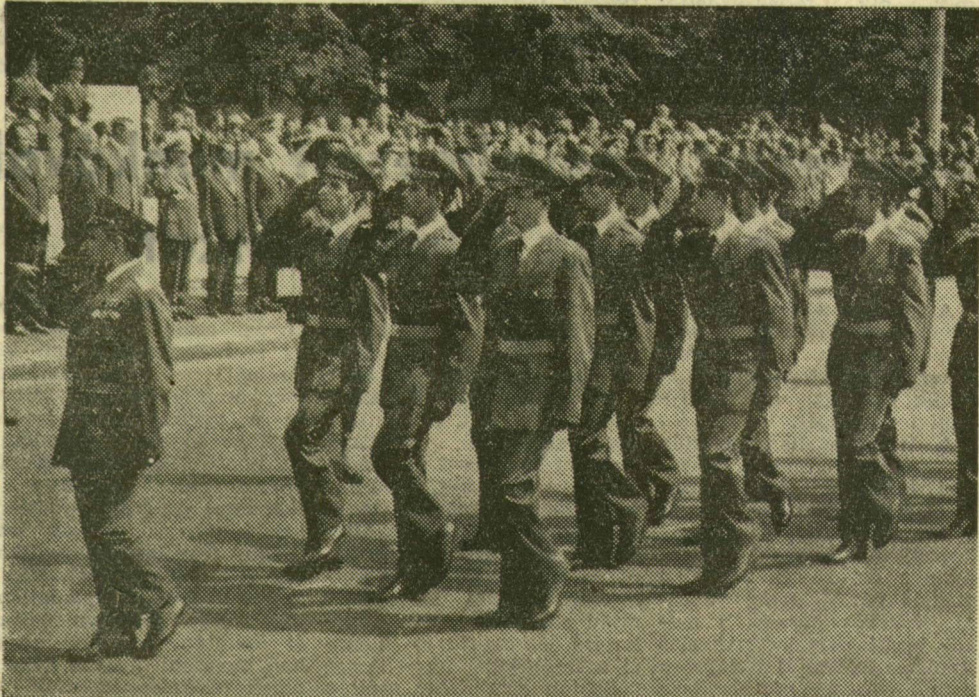
A fogadalmat tett és az állami zászló előtt felvonuló új tisztek egy csoportja

A hagyományokhoz híven az idén is a munkás-paraszt szövetség jegyében ünnepeltük meg szerte az országban az új kenyér ünnepét, s alkotmányunk törvénybe iktatásának évfordulóját. Munkás-paraszt találkozót tartottak az ünnepen, s az országban számos gyermek- és közművelődési intézményt avattak föl. Számos helyen nagygyűlést tartottak. A több nemzetiségű Pécsvaradon, Baranya megye központi alkotmánynapjainak ünnepségén Ovári Miklós , az MSZMP Politikai Bizottságának tagja, a Központi Bizottság titkára mondott beszédét.