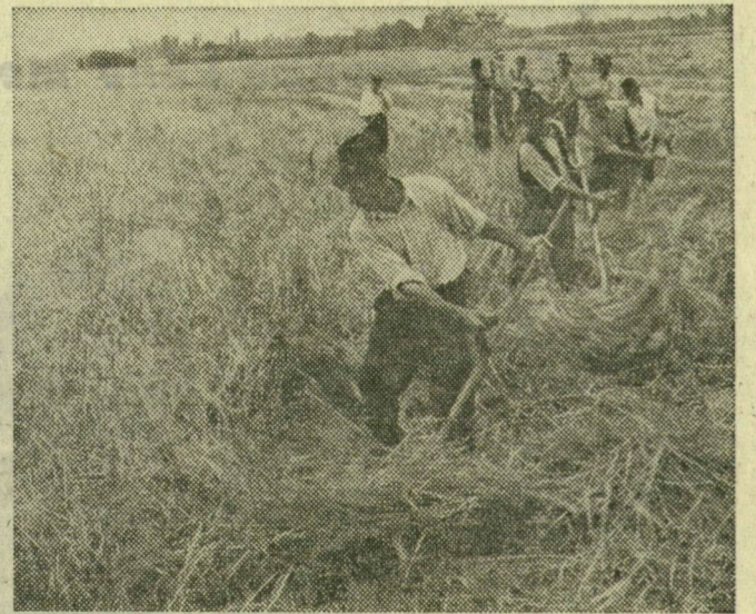
Ez a felvétel nem 1955-ben készült, hanem 1975-ben. Még akadtak néhányan, akik nem felejtették el kaszálni

És megtörtént a hihetetlen: 1975-ben még parasztembereket kaphatott lencsevégre a fótós, akik kézi kaszával nyúlták-nyesték tocsogós földön az összekaszált gabonát. Így történt ez a Szeged környéki földeken is. Ez azonban már ritka kivétel volt, szerencsés fotósoknak kellett lenni, aki ilyet elkapott. Mert ha picit szűnt az eső, szikkadt a föld, dolgozni lendült a gépek serege. Sárton keresztülgázolva, kuszált szalmával szembeforogva indultak újból és újból munkába a kombájnok. Amint visszaszorult a természet, fogott a gabona, úgy jelent meg egyre több gép a még