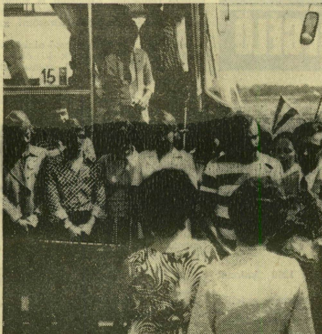
Az odesszai küldöttség fogadása Csongrád megye határán