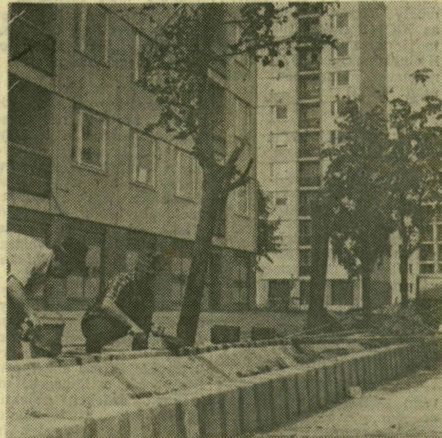
A Bihari utcában az út szegélyének kockakövei közé betont öntenek, merítőkánállal

Felsővároson, a József Attila és a Szilléri sugárút, valamint a Debreceni és Retek utca által határolt területen már megkezdődött az új lakások átadása. Ezekben a napokban is sok család foglalja el kényelmes otthonát a József Attila sugárúti házakban. A terület belső részén azonban még sok tennivalójuk van a DELEP munkásainak: utakat építenek, csatornáznak. Képeinken ezeket a munkafolyamatokat örökítettük meg.