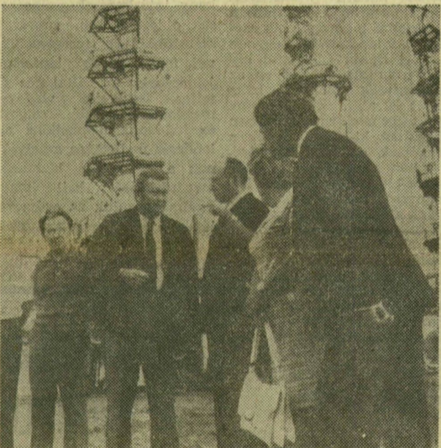
Az olajmezőn