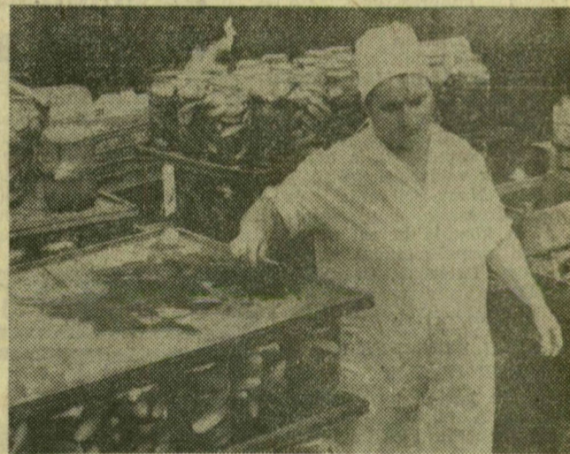
Csemegeuborkát palackoznak a délelőtti műszakban

Július elején kezdődött meg az uborka feldolgozása a Szegedi Konzervgyárban, s azóta közel kétszáz vagonnyi készárú került a raktárakba, illetve a vásárlók asztalára. Az üvegbe zárt csemegeuborkák mintegy 30 százalékát értékesítik hazai piacon, a többi demokratikus és tőkés országokba kerül.