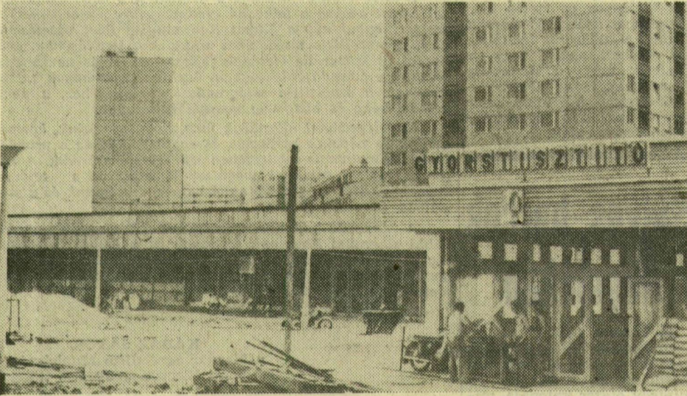
Az ABC-áruház és a bisztró. Az előtér még rendezetlen, de az átadásra mindent rendbe tesznek

Szeged üzlethálózata tovább gyarapodik Tarjánban, Gedő szomszédságában, a 6-os számú lakásépítési tervben. Járulékos beruházásként a városi tanács itt építtetett meg egy szolgáltatóházat, amelyben helyet kap a Patyolat Vállalat: mosó- és vegytisztító szalonnyit; a férfi és női divatszabó állalat, a Szegedi Fodrász Vállalat, a GELKA és az OFOTERT. Az építkezéseket hamarosan befejezik. A szolgáltatóházban nagyszabású munka folyik, a Patyolatnál szerelik a gépi berendezéseket. A többi üzletben is gyorsul a munka, mert várhatóan augusztusban adják át a tarjániaknak az ötféle szolgáltatást nyújtó üzletházat.