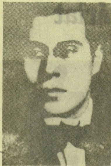
SZEGEDI FÉNYKEPE 1919-BŐL