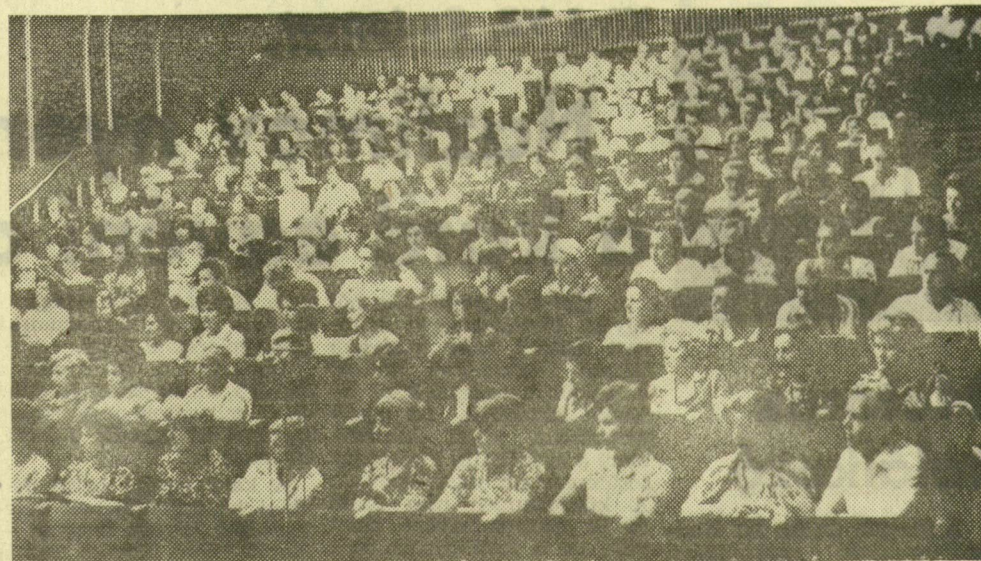
Csaknem négyszázan ismerkednek a pedagógiai nyári egyetem idei programjával, a pedagógiai kutatások legfrissebb eredményeivel. A megnyitóra megteltek a széksorok a biológiai központ újszegedi előadótermében.

A MÓRA FERENC MŰZEUM ÁLLANDÓ KIÁLLÍTÁSAI.