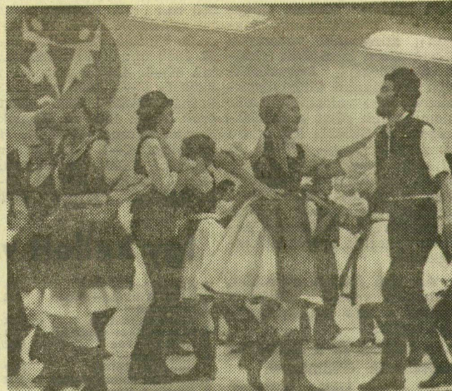
A Vegyipari Dolgozók Szakszervezetének Bartók Táncgyűjtése a hozzá csatlakozott Sebő népzenei együttes művészei tőrekvései azonosak, mindig a tiszta forrásokhoz nyúlnak vissza. Ennek köszönhetik sikerüket, bárhol is megfordulnak.