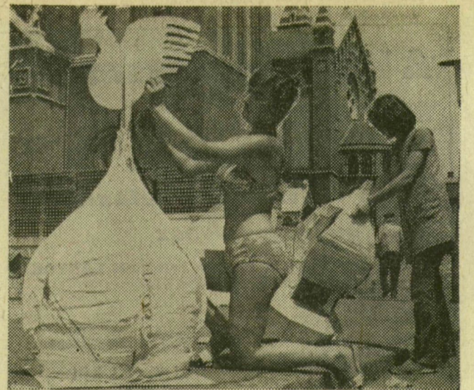
Készülnek a Fidelio díszletei

Elsőnek az asztalosok kezdték meg a munkát a Dóm téren, de már dolgoznak a díszletfestők is. A fakeretekre szögezett hatalmas vásznak a tér közepére fektetve mintázzák, díszítik. Úgyes kezű diákok is segítenek, legnagyobb számban a Tömörkényiből, akik az utóbbi években rendszeresen részt vesznek a szabadtéri játékok műszaki előkészületeiben. Felvételeink bepillantást nyújtanak a Dóm téri műhely életébe.