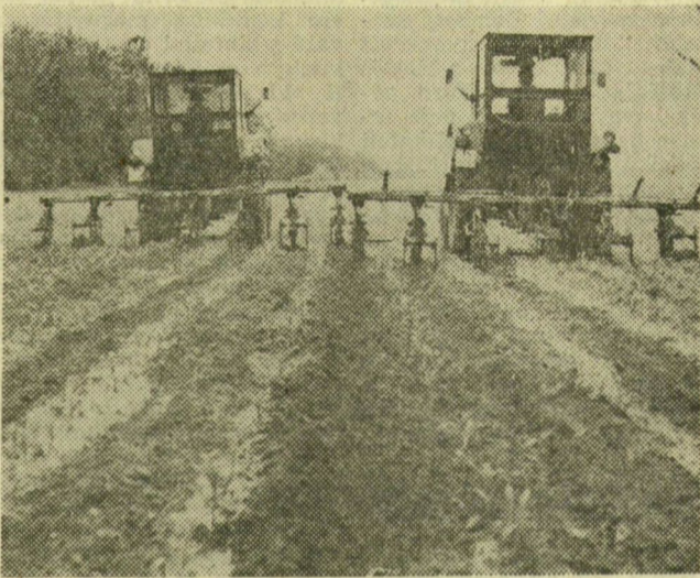
A kukorica első kapálása

A homoki területen gazdálkodó forráskúti Haladás Termelőszövetkezetben mintaszervezet, precíz szerveztek meg a tavaszi munkákat. Ezekben a hetekben korai burgonyát 100 hektárról takaríthatnak be, terveik szerint 8500 mázsát várnak. Burgonyatermesztéséről hí-