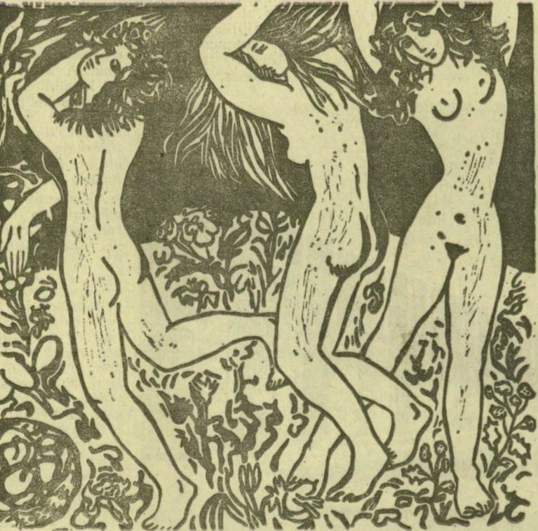
Benyó Lajos grafikái