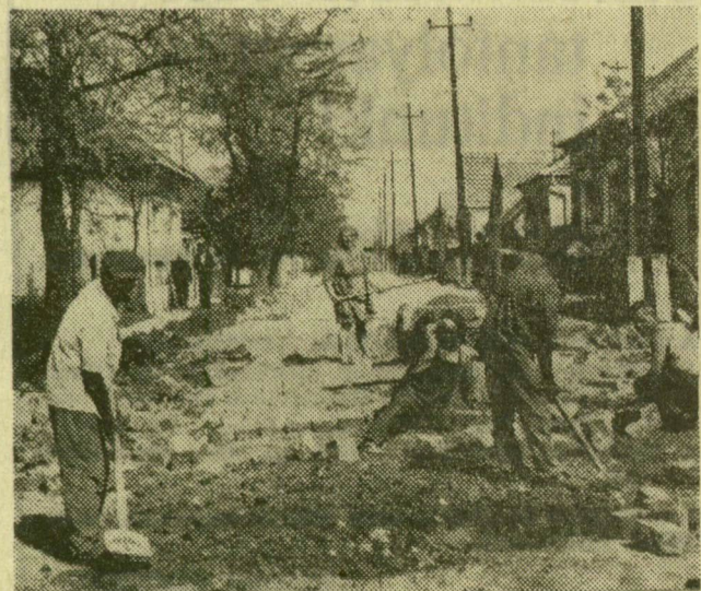
Kövezik az utcát

Jó lenne, ha megszüntetnék a homokbányát Szeged belterületén és a tanács a homokkitermelés tilalmát a strand fölötti szakaszra is kiterjesztené, és annak betartását szigorúan ellenőriztetné. Lehet, hogy gazdaságos az itteni homokszedés, de a szép városképet a gazdasági érdek fölé is lehet helyezni. A város esztétikai képéhez a Tisza újszegedi partja is hozzátartozik, nem lenne szabad hagyni, hogy elcsúfítsák.”