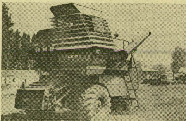
Megérkezett az új kombajn

Péter-Pálkor, a homokvidékeken kezdődik az aratás. A közös gazdaságokban már gondolkodnak ezzel és javítják a kombájnokat, munkagépeket, ahol a lehetőség engedi, újakat is vásárolnak. A kisteleki Új Élet Termelőszövetkezetben most érkezett meg az új, szovjet SZK-5-ös nagy teljesítményű kombajn, s a meglévő két SZK-4-essel együtt időben és szemvesztés nélkül tudják betakarítani majd az ideit termést. Az új szerzemény megérkezte a régi, öreg SZK-3-as kombajnt lucernakaszálásra állították be.