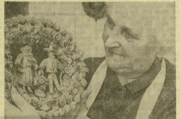
A morva népművészek díszes ünnepi kalácsokat készítenek a nemzeti ünnepre. Különösen Vizovicében ápolják ezt a szép hagyományt

A Szeged Étterem nagyon jól érvényesül Brnóban. Kedvelt az itt készített babgulyás-leves csabai kolbásszal, kerestek a különböző halételek és más készítmények is, amelyek elkészítésénél paprikát használnak ízesítőül. Közkezdveltségének legjobb bizonyítékai a vendégkönyvben olvasható beírások. A vendégek érdeklődése már most meghaladja a Szeged Étterem kapacitási lehetőségeit.