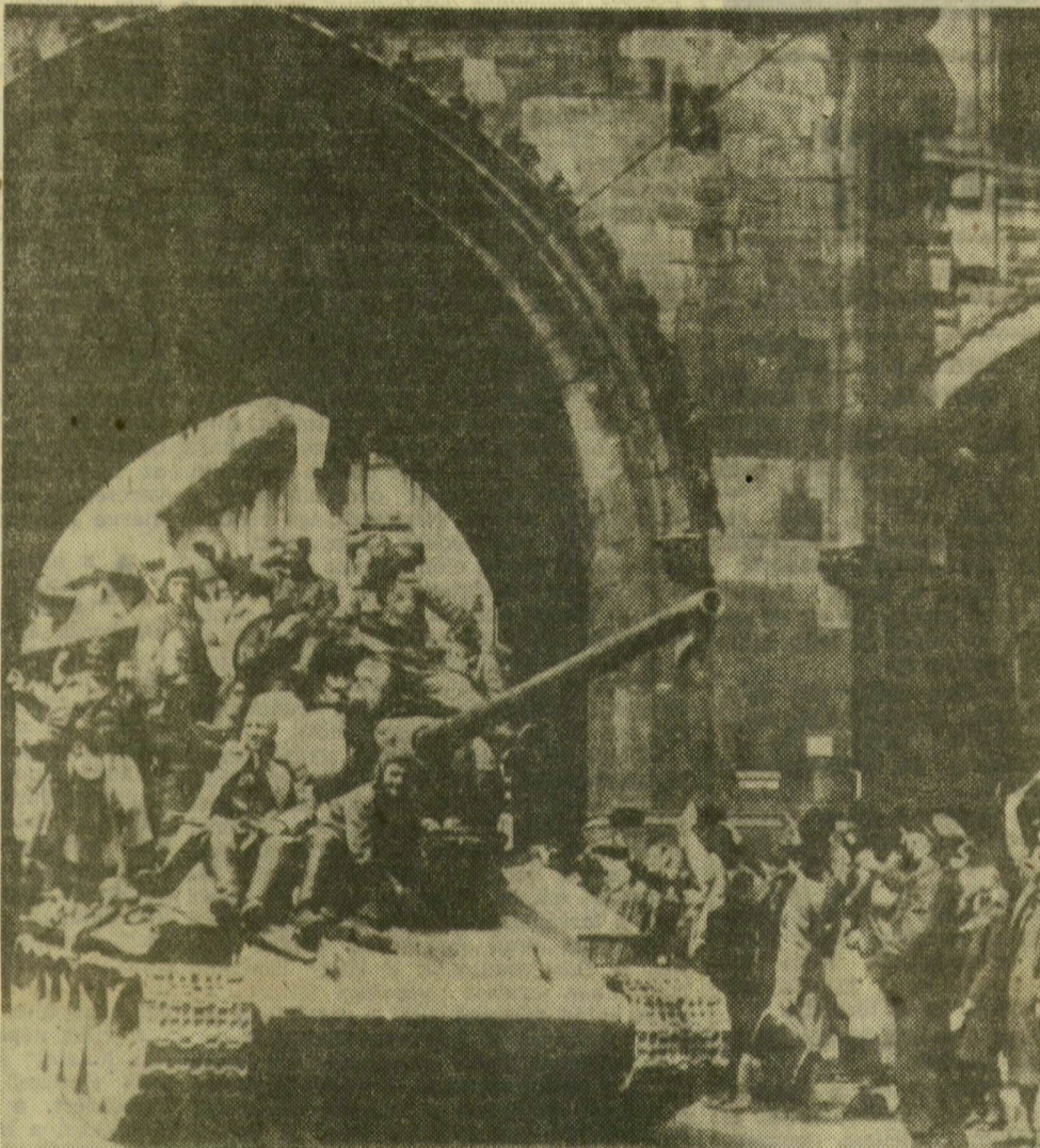
A csehszlovák főváros lakói üdvözlik az egyik szovjet harcokosi légénységét a Lópor-toronyánál, 1945. május 9-én

Április 4-én egész oldalas összeállítással köszöntötte Magyarország felszabadulásának ünnepét csehszlovákiai testvérlapunk, a brnói Rovnost. Most, Csehszlovákia szabadságának ünnepén, május 9-e alkalmából a Rovnost a Délmagyarország vendége: a viszonzásként kapott cikkekkel, fényképekkel köszöntjük a szocialista testvérország történelmi sorsfordulóját — így elsősorban a Brno életéből vett epizódokkal villantjuk fel a testvérváros életének egy-két sajátosságát.