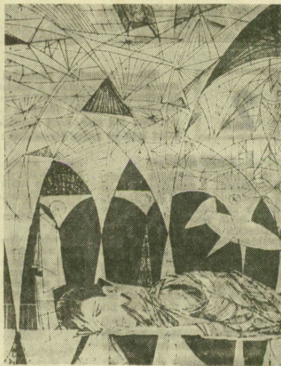
KASS JÁNOS JÓZSEF ATTILA-ILLUSZTRÁCIÓI