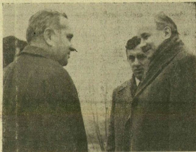
Fogadás a határon