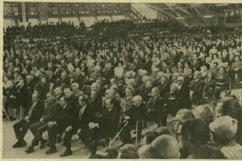
A nagygyűlés résztvevőinek egy csoportja.

Büszkeséggel emlékezünk azokra a honfitársainkra, akik fegyverrel a kézben, a szovjet hadsereggel, Európa különböző harcmezőin, vagy hazánk területén partizánként harcoltak a fasiszmus ellen. Azokra az elvtársaink-