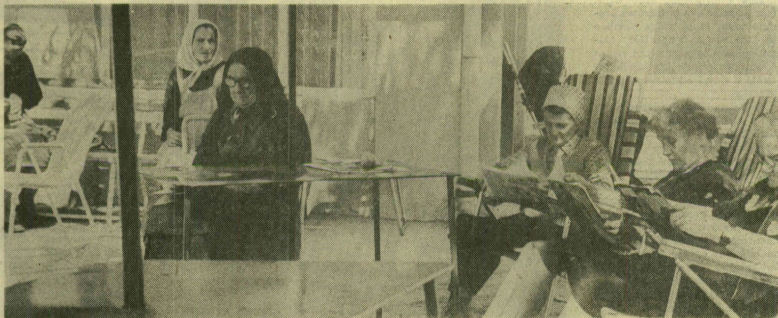
Az öregekről, a tegnapi építőmunka derékhadáról körültekintően gondoskodik a társadalom, csupán nyugdíjakra évente több mint 20 milliárd forintot fizet ki az állam. A társadalmi segítőkészség szép példái az öregek számára mind több helyen létesített napközi otthonok.